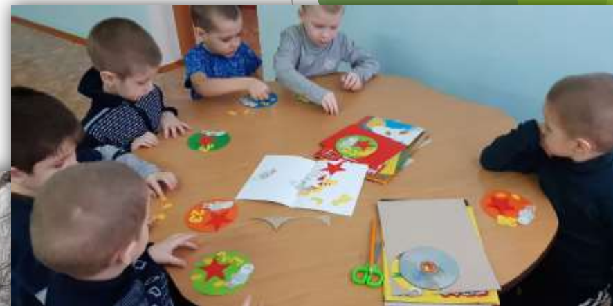
Открытка для папы