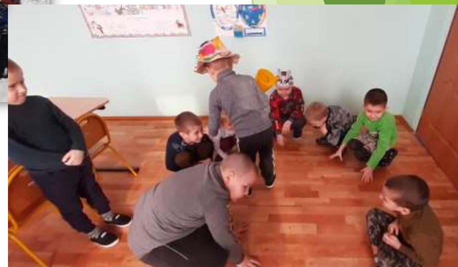
Русская народная игра «Дедушка и капуста»