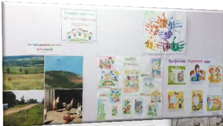
Конкурс плакатов «С чего начинается Родина?»