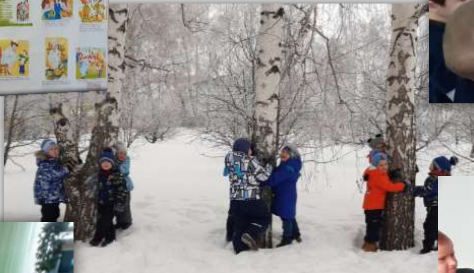
Прогулка «Белая берёза»