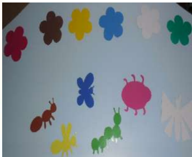
Д/И «Спрячь насекомых»