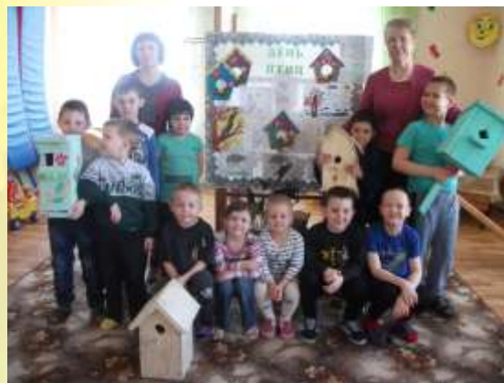
Акция «Прилетайте птицы»