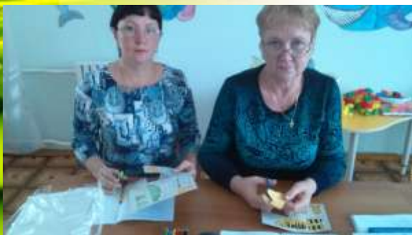
Мастер класс по детско-родительскому творчеству