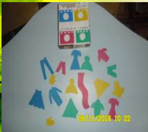
Д/И «Большая стирка»